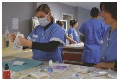
Salle d'entraînement procédural