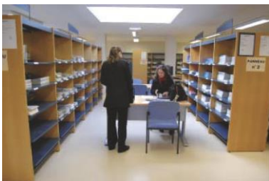
Centre de ressources en information

Grâce à vos versements, nous améliorons chaque année les conditions matérielles indispensables pour dispenser des enseignements innovants et pertinents face aux besoins d'apprentissage des étudiants et élèves ainsi que leur qualité de vie au sein des instituts.