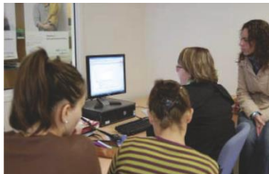
Travail de groupe

Liste des habilitations : https://www.prefectures-regions.gouv.fr/pays-de-la-loire/Region-et-institutions/L-action-de-l-etat/Taxe-d-apprentissage