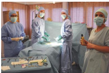
Atelier de pratique simulée au bloc opératoire