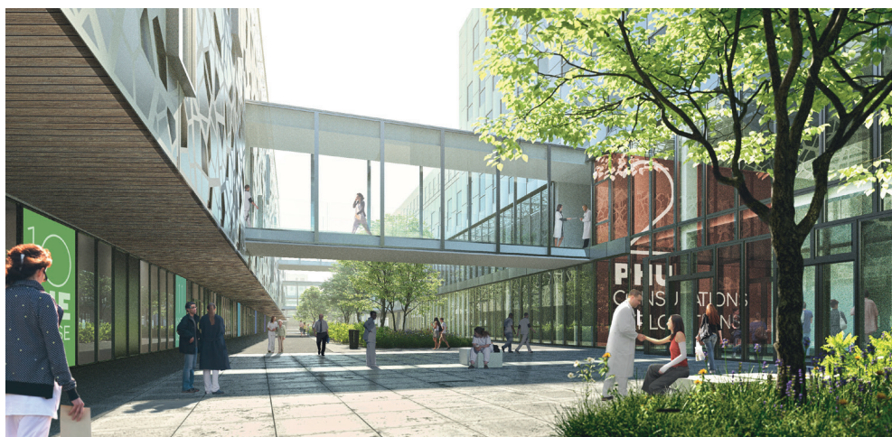
© Art&Build, Pargade Architectes, Artelia, Signes Paysages

Le projet de nouvel hôpital sur l'île de Nantes a officiellement été validé le 3 septembre 2013, avec l'accord de financement donné par Marisol Touraine, Ministre des Affaires Sociales et de la Santé et après plusieurs expertises externes (Inspection Générale des Affaires Sociales, Conseil Immobilier de l'Etat...).