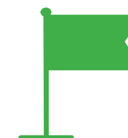
MARQUE « CHU DE NANTES »