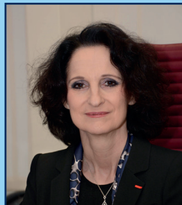
Pr Pascale Jolliet doyen de la faculté de médecine de Nantes