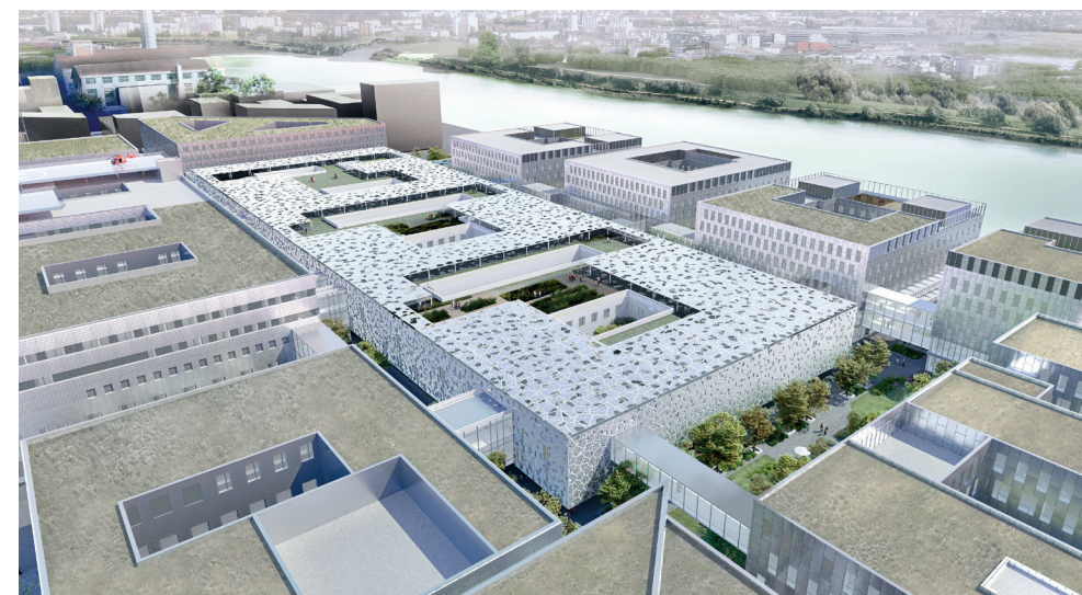
© Art&Build, Pargade Architectes, Artelia, Signes Paysages

Avec la construction du nouvel hôpital sur l'île de Nantes, c'est un nouveau modèle hospitalier qui s'invente pour offrir les meilleures conditions d'accueil et de prise en charge des patients. Le défi relevé est celui de la conception d'un hôpital ouvert sur la ville, conscient de sa responsabilité environnementale, anticipant la révolution numérique, en lien étroit avec ses partenaires et offrant un environnement agréable, pour contribuer au « bien-être » des patients et des professionnels.