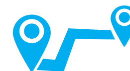
LIEN VILLE / HÔPITAL