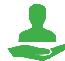
AMÉLIORATION DE L'ACCUEIL DU PATIENT