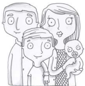
je voudrais voir maman, papa, mon frère, ma soeur