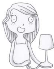
je voudrais allumer la lumière