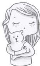
je voudrais mon doudou, ma poupée