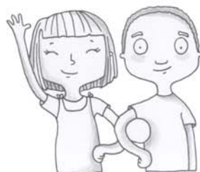
je voudrais voir mes copains