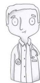
je voudrais voir le docteur