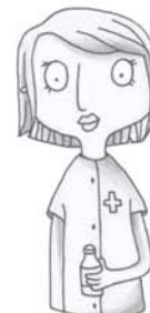
je voudrais voir l'infirmière