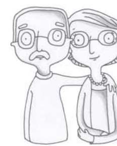
je voudrais voir papi, mamie