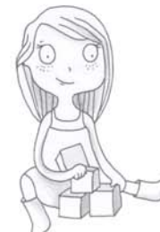
je voudrais jouer