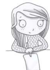
je voudrais écrire, dessiner, colorier