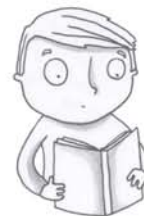
je voudrais lire