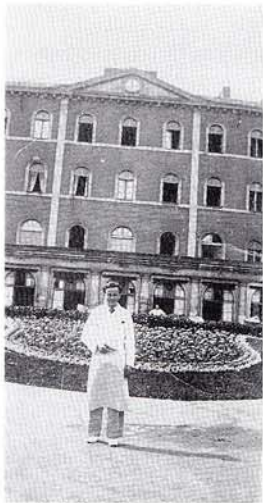
Hôpital Saint-Jacques face aux anciennes cuisines

Nous sommes hébergés dans des cantonnements près de l'usine, cernés de grilles. La nourriture est de mauvaise qualité et insuffisante mais, à vrai dire, guère différente de celle de la population qui nous entoure. C'est là que j'ai réellement compris ce que signifie la solidarité : lorsque des colis parvenaient, ils étaient intégralement partagés. Malgré tout, nous avions souvent faim. A Noël 1943, on réussit, grâce à une pince-monseigneur fabriquée sur un étau de l'usine, à faucher des lapins dans un clapier du voisinage : j'en embarque deux au hasard dans un sac. Au retour, on bute sur une patrouille alors que le dit sac est agité de soubresauts : les deux pauvres bêtes, ignorant le sort qui les attendait, se témoignaient une dernière fois leur affection. Rigolade générale.