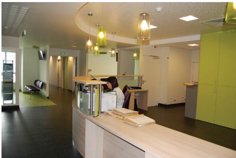
accueil de l'unité de chirurgie ambulatoire

Une surveillance postopératoire est assurée en salle de réveil, elle permet un retour dans l'unité ambulatoire, sans risque avéré, puis la sortie du patient le jour même de son admission. Pour certaines interventions, des soins à domicile vous seront prescrits.