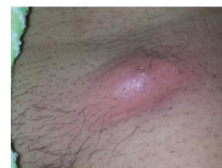
Bubon inguinal - E. Bertherat, OMS Genève

Le patient a-t-il une adénopathie inflammatoire inguinale ou axillaire ?