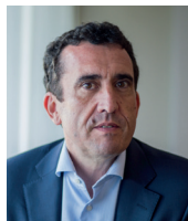
Pr Karim ASEHNOUNE Président de la commission médicale d'établissement