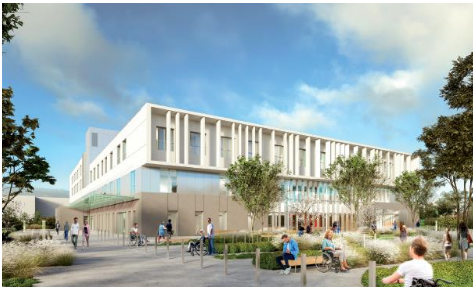
Futur bâtiment de MPR du CHU de Nantes

Cette activité devra répondre aux enjeux de santé publique de son territoire, pour une meilleure prise en charge des patients souffrant de pathologies cardiaques, pris en charge au CHU de Nantes ou dans d'autres établissements environnants. Cette activité sera poursuivie en lien et avec le support du pôle cardio-vasculaire du CHU de Nantes. Elle prendra place au sein du pôle de Médecine Physique et de Réadaptation du CHU, qui porte actuellement un projet de reconstruction complète d'envergure nationale ( plus d'information : https://www.chu-nantes.fr/medecine-physique-et-readaptation--76200.kjsp ), dont l'achèvement est prévu pour 2022.