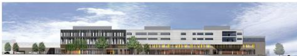
Futur bâtiment de MPR du CHU de Nantes

Le CHU de Nantes est composé de 12 Pôles Hospitalo-Universitaires (PHU). Il est l'établissement support du Groupement Hospitalier de Territoire 44, dont 13 établissements sont membres, soit l'ensemble des hôpitaux publics du département de Loire Atlantique.